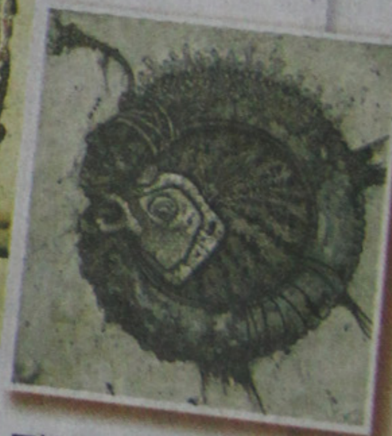
■ William 以環保為題材的 Amazing Fish 系列，線條細膩及強烈。

展期：即日至6月18日 地點：九龍石硤尾白田街30號賽馬會創意藝術中心 L1-05 Cafe Golden