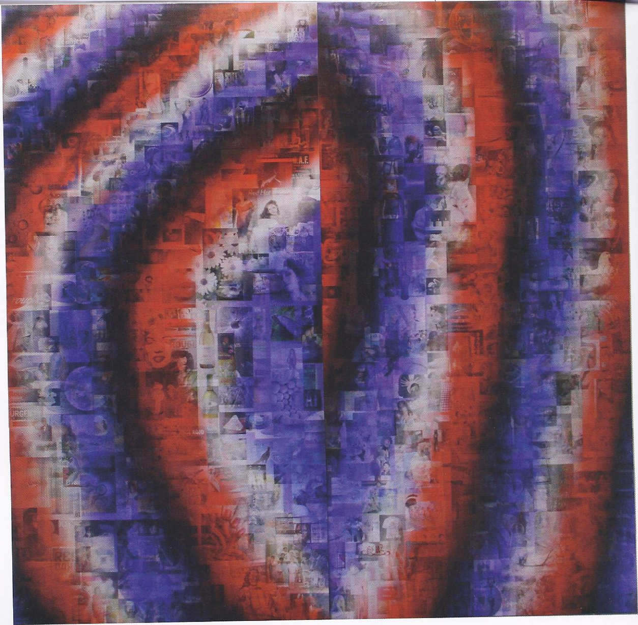
Eurasia (Google_Rouge-Blanc-Bleu-Noi_Ouest/Est). 2012, lenticulaire sur alu-dibon et chassis, 180 x 180 cm.