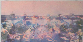
《Meet the Dragon》